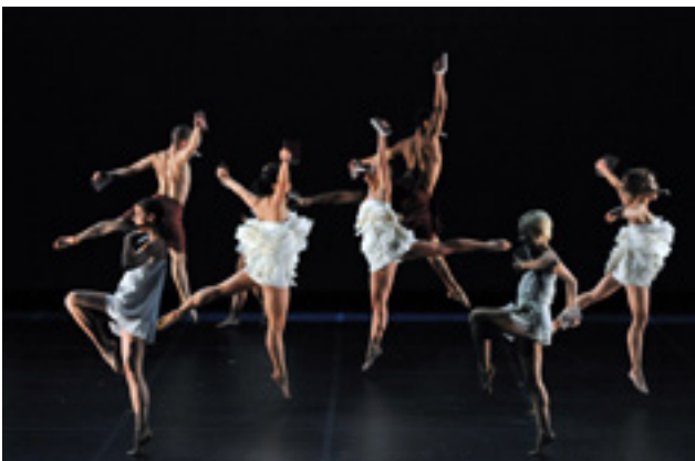
Photo de scène, Suivront mille ans de calme , Ballet Preljocaj, groupe des « chicken » 2010

En 2010, Angelin Preljocaj est l'invité du Bolchoï. Il adapte le thème de l'Apocalypse selon St Jean en réunissant dix danseurs du Bolchoï et onze artistes de sa compagnie. Les artistes évoluent dans un décor inquiétant, animé par des accessoires évoquant le monde du travail, l'esclavage ou bien la censure religieuse sur une musique « chaotique et sombre ». Igor Chapurin, couturier russe, imagine des tuniques courtes, des shorts plissés, des bodys de jersey drapé, en soie ou coton selon un jeu savant de lignes épurées et aériennes, permettant ainsi une totale liberté aux corps et à l'expression de leurs mouvements, rapides et vifs. Ce ballet électrique bouscule la scène du Bolchoï en décrivant une fresque chaotique de l'humanité teintée d'une certaine violence révolutionnaire.