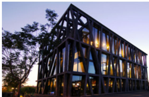
Le Pavillon Noir, R. Ricciotti, Aix-en-Provence

En octobre 2006, le Ballet Preljocaj a investi son nouveau lieu conçu par l'architecte Rudy Ricciotti : le Pavillon Noir est le premier centre de production construit pour l'activité qu'il abrite où les artistes peuvent mener leur processus de création en intégralité, du travail en studio à la représentation sur scène. Dans son Théâtre et ses quatre studios, des rencontres et des spectacles de danse sont proposés toute l'année : ceux d'Angelin Preljocaj et de compagnies invitées.