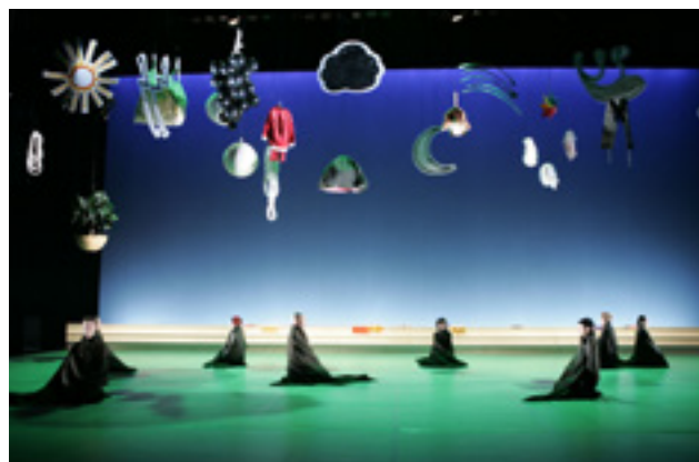
Photo de scène, Les 4 saisons... , Ballet Preljocaj, 2005

Fabrice Hyber s'intéresse ainsi au détournement des fonctions premières d'objets du quotidien en créant des « POF », prototypes d'objets en fonctionnement. Au milieu de ce décor, déambulent des personnages étranges et sympathiques tel le hérisson, revêtu intégralement de pics pointus en plastazote ou bien le POF « Homme-éponge », créé à partir de véritables éponges fixées sur un collant académique. C'est un ballet inventif combinant le classicisme de la musique, la modernité de la danse et l'intervention ludique et hétéroclite de Fabrice Hyber.