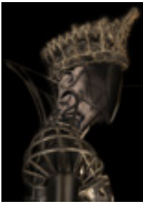
Costume de Jean Paul Gaultier pour le rôle de la Reine dans Blanche Neige , Biennale de Lyon, A. Preljocaj, 2008