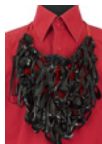
Costume d'Olivier Bériot pour le rôle d'un homme de la cour dans Siddharta , Opéra national de Paris, A. Preljocaj, 2010