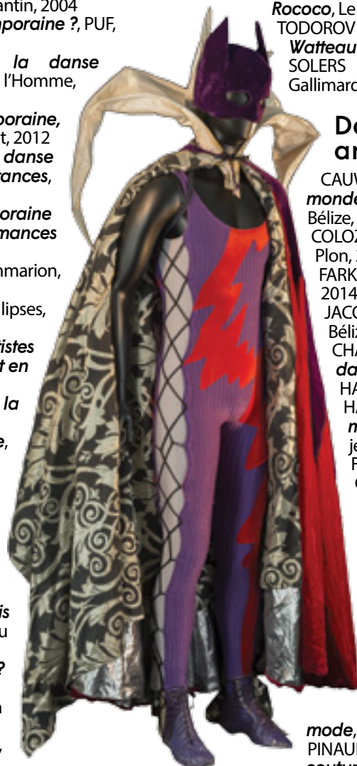
Costume d'Hervé Pierre pour le rôle de Batman dans Parade , A. Preljocaj, ONP, 1993