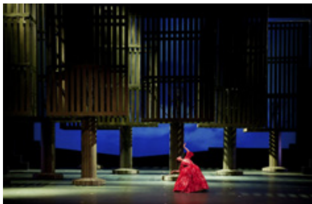
Photo de scène, Le Parc , Isabelle Guérin, danseuse étoile, rôle principal, ONP, 1994

Le Parc est un ballet qui s'inspire des relations galantes des XVII e et XVIII e siècles. Angelin Preljocaj imagine une chorégraphie du discours amoureux et de ses codes dans le cadre bucolique d'un jardin à la française. Le couturier Hervé Pierre choisit des rééditions de tissus de cette époque pour la confection d'habits à la française et de robes à paniers conférant ainsi au ballet une esthétique historique, élégante et raffinée. Le chorégraphe réussit à tirer parti du volume et des contraintes évidentes de ces costumes pour construire sa chorégraphie. Le Parc connaît un très vif succès dès les premières représentations. Il est toujours toujours au répertoire de l'Opéra de Paris.