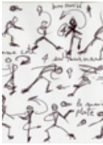
D'après les dessins d'Angelina Preljocaj

Niveau maternelle, élémentaire, collège, lycée (3-18 ans)