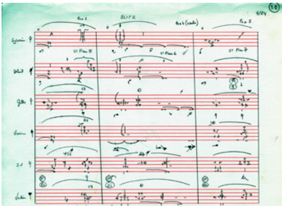
Détail de la notation chorégraphique pour Paysage après la bataille , A. Preljocaj, 1997 © Dany Levêque notation Benesh

Huit à douze heures de travail sont nécessaires pour écrire une minute de danse.