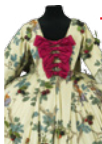
Costume d'Hervé Pierre pour le ballet Le Parc , A. Preljocaj, ONP, 1994